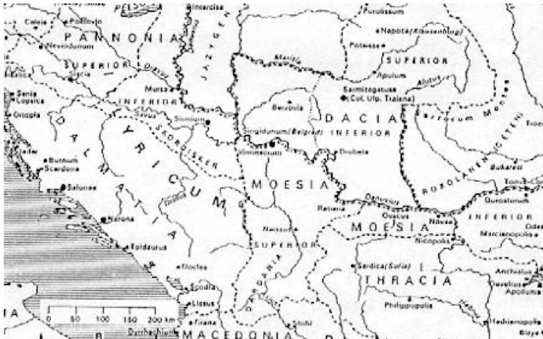
karta Balkanskog poluostrva ( Dakija, Trakija i Moezija)

Pre nego što su Rimljani počeli još u II veku pre nove ere da osvajaju Balkan, (146.g. pre nove ere su Makedonija i Grčka već bile rimske provincije), na današnjim teritorijama istočne Srbije prostirale su se Moezija i Trakija čije je stanovništvo (mešana plemena) govorilo nekom mešavinom azijsko-evropskog jezika, gde je bilo i pojmova iz latinskog i germanskog jezika. Severno, odvojena Dunavom, prostirala se Dakija. Tračani su narod indoevropskog porekla. Pretpostavlja se da već tokom neolita otpočinje formiranje Tračana (kulture Karanovo, Veselinovo, Marica, Gumelnica). Prvi pisani izvor u kome se spominje Trakija (tre-ke-wi-ja) jesu mikenske tablice ispisane linearnim pismom B (XIV - XIII vek pre nove ere). Najranije podatke o Trčanima daje Homer (VII veku pre nove ere). Po Ilijadi, Tračani su se u trojanskom ratu borili na strani Trojanaca, protiv Grka, a njihov najveći junak bio je Res. Rimljani polako ali sigurno osvajaju Trakiju i Moeziju, a 106. godine pre nove ere car Trajan osvaja celu Dakiju proslavivši se pobedom nad kraljem Decebalusom. Sprovodi se romanizacija stanovništva i uvodi se rimska kultura. Latinski jezik postaje osnovni jezik. 272. godine pod pritiskom i najezdom germanskih Gota, Rimljani i deo stanovništva napuštaju teritorije Dakije i naseljavaju se južno i istočno od Dunava (deo današnje Srbije i severna Bugarska). Ipak veliki deo stanovništva ostaje u Dakiji, Trakiji i Moeziji gde je ipak uspevalo da sačuva do današnjeg dana tradiciju, kulturu i